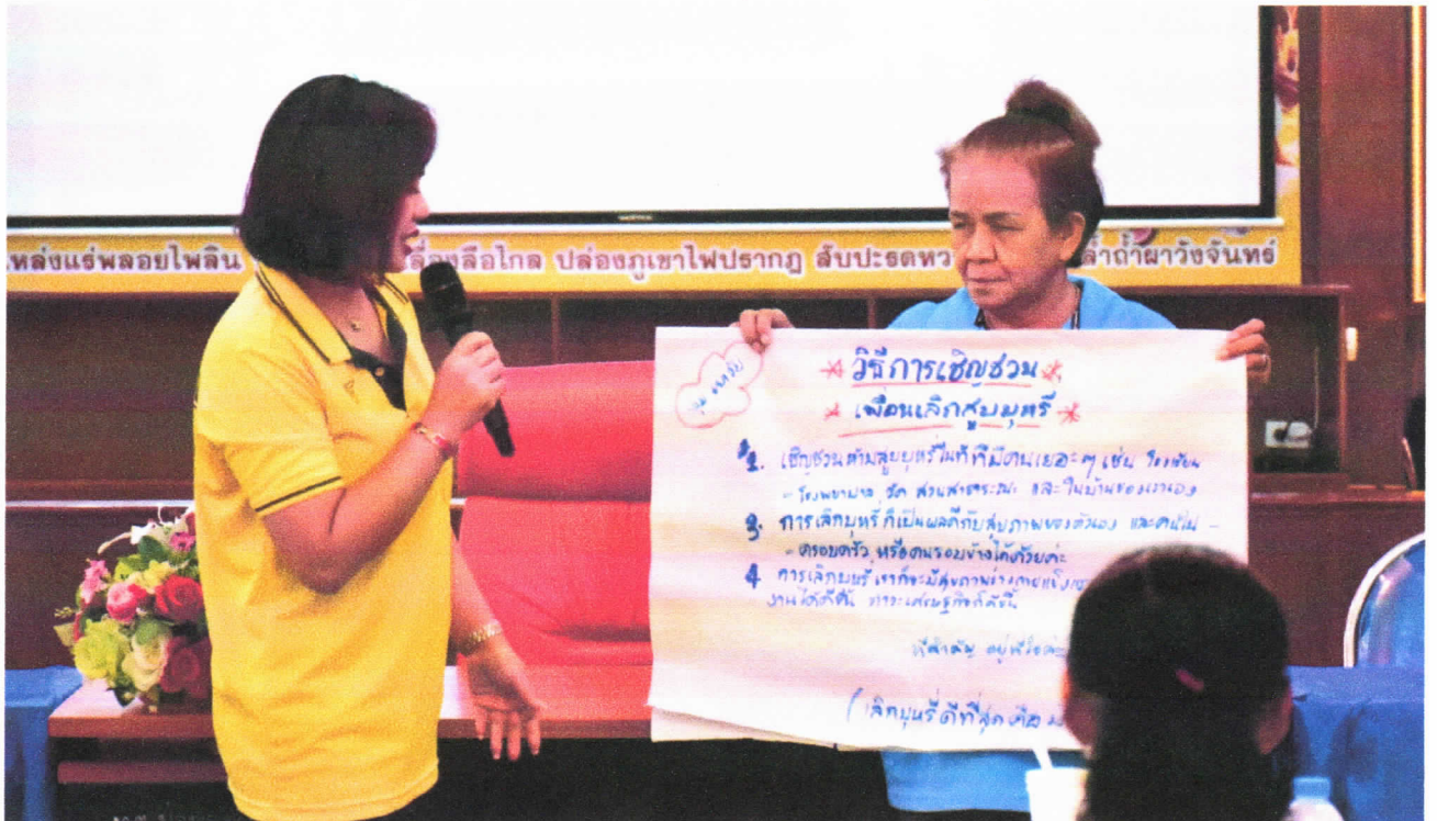
๓. กิจกรรมการฝึกอบรมให้ความรู้การปรับเปลี่ยนพฤติกรรมสุขภาพ ลด ละ เลิกบุหรี่